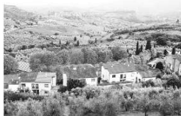
Una strada particolare

Dopo il secondo ascolto avrete 45 secondi per controllare le vostre risposte.