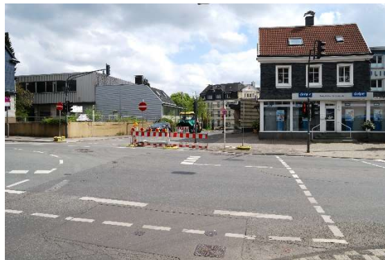
Abb. 3: Amboßstraße Erweiterung ZVB

Die von dieser Änderung nicht betroffenen und verbleibenden Flächen des GIB im Stadtteil Cronenberg dienen der Absicherung der dort noch vorhandenen gewerblichen Strukturen, hier insbesondere mit Rücksicht auf die größeren Standorte der Werkzeugindustrie „Stahlwille“ westlich und östlich der Lindenallee sowie „Cleff“ südlich der Kemmannstraße.