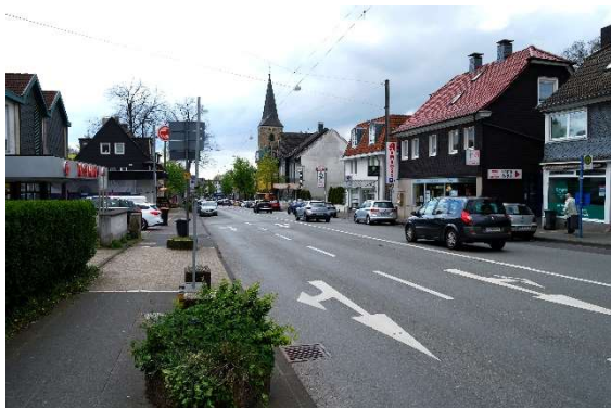
Abb. 2: Hauptstraße ZVB - Cronenberg

Wuppertal ist beabsichtigt, künftig eine potentielle Erweiterungsfläche des ZVB Cronenberg durch die Ansiedlung eines Lebensmitteldiscounters mit einer voraussichtlichen Verkaufsfläche von ca. 1.000 m 2 (plus Bäckerei-Café 120 m 2 ) und darüber gelagerten Wohnungen zu entwickeln. Im FNP ist die Darstellung der Bauflächen als Kerngebiet gemäß § 7 Baunutzungsverordnung (BauNVO) vorgesehen. Ziel ist die Stärkung der Hauptstraße als zentrale Lage. Diese bauleitplanerischen Überlegungen stehen im Einklang mit der vom Rat der Stadt Wuppertal am 24. Juni 2020 beschlossenen Fortschreibung des Einzelhandels- und Zentrenkonzepts. Da der Landesentwicklungsplan Nordrhein-Westfalen (LEP NRW) gemäß Ziel 6.5-1 Vorhaben im Sinne des § 11 Absatz 3 BauNVO nur im Allgemeinen Siedlungsbereich ermöglicht, ist für die Verwirklichung dieser, auch aus städtebaulicher Sicht, nachvollziehbaren Überlegungen die regionalplanerische Änderung von GIB in ASB erforderlich. Der gesamte Bereich der Regionalplanänderung hat eine Größe von 5,1 ha.